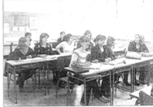
Alumnos en un aula del Centro de Educación de Adultos del Nalón.

Segunda, L. C. En estos momentos de crisis económica, los adultos pueden ampliar su formación en el centro de educación de mayores del Nalón. Este centro ofrece cursos a todos los niveles, desde la alfabetización hasta la formación profesional. Los cursos están diseñados para ser prácticos y útiles, y se imparten en un ambiente de respeto y apoyo. El centro también ofrece servicios de orientación y asesoramiento para ayudar a los adultos a tomar decisiones sobre su formación.